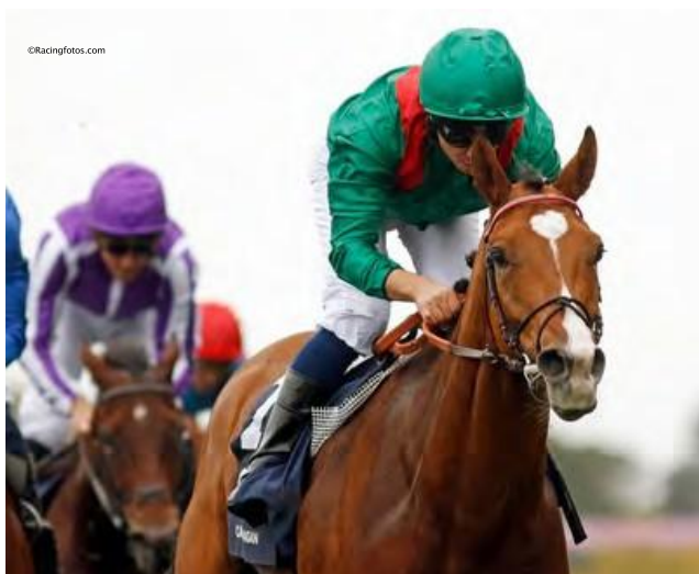
Calandagan lidera el Ranking Longines del Mejor Caballo de Carreras del Mundo 2025

La próxima edición del ranking, el Ranking Longines de los Mejores Caballos de Carrera del Mundo 2025, se publicará el 20 de enero de 2026.