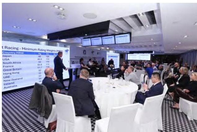
La conferencia contó con un enfoque aplicado y basado en evidencia.