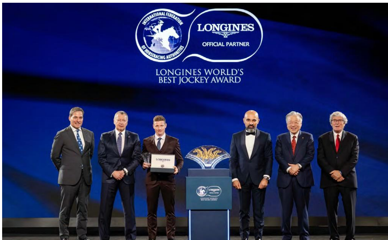
James McDonald fue honrado a principios de este mes como el Mejor Jockey del Mundo Longines 2025 por Longines y la IFHA