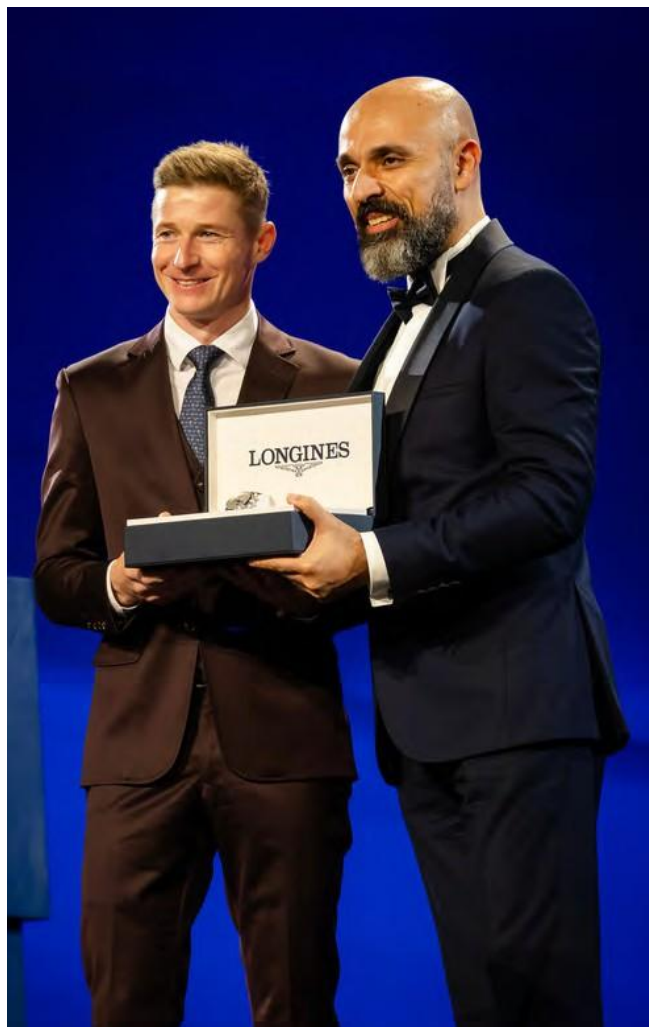
El CEO de Longines Patrick Aoun se unió a las celebraciones

Se puede acceder a la clasificación completa y final del concurso Mejor Jockey del Mundo por Longines 2025 en www.ifhaonline.org .