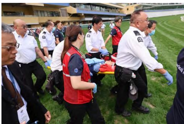
Los participantes pudieron observar eventos con simulación en vivo.