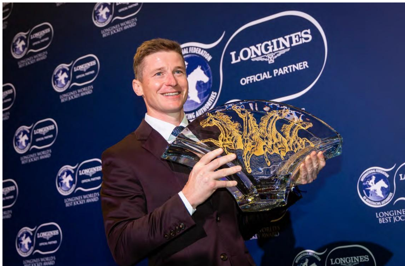
McDonald ha Ganado el título de Mejor Jockey del Mundo por Longines tres veces