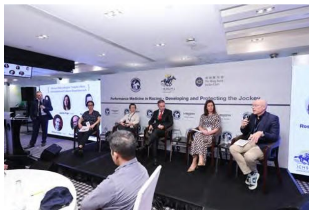
La conferencia contó con 13 sesiones únicas.