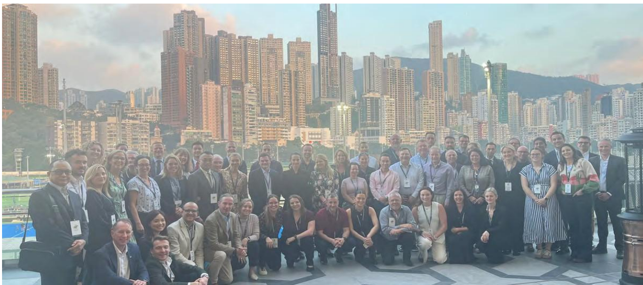
La edición 2025 de la Conferencia Internacional para la Salud, Seguridad y Bienestar de Jockeys (ICHSWJ) se celebró del 11 al 12 de diciembre en Hong Kong.

La ICHSWJ se celebró por última vez en octubre de 2023, coincidiendo con la 57ª Conferencia Internacional de Autoridades Hípicas y otras reuniones relacionadas con el fin de semana del Prix de l’Arc de Triomphe.