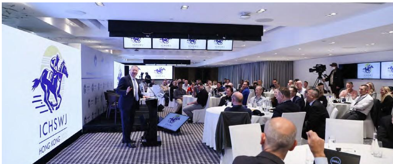
El discurso del presidente estuvo a cargo de Winfried Engelbrecht-Bresges, presidente de la Federación Internacional de Autoridades Hípicas (IFHA).