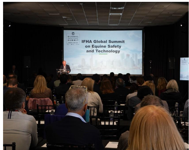
La Cumbre Global en Seguridad Equina y Tecnología se llevó a cabo en Junio

Los resultados de la Cumbre serán analizados por el Consejo Ejecutivo de IFHA, en miras a desarrollar recomendaciones para los miembros de IFHA a la hora de abordar los riesgos de fracturas y EASD en el futuro. La IFHA agradece el apoyo de la Fundación en Memoria de Harry M. Zweig para Investigaciones Equinas de la Universidad Cornell, la Fundación para Investigaciones en Bienestar Equino de The Hong Kong Jockey Club, y a Woodbine Entertainment Group, por la exitosa organización de esta Cumbre.