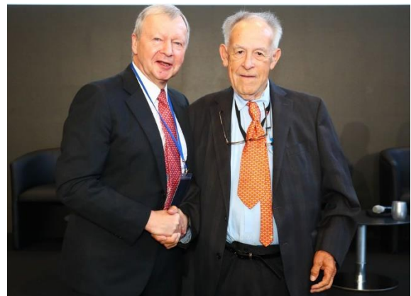
Presidente de IFHA Winfried Engelbrecht-Bresges y Dr Roland Devolz en Octubre 2023

"Era implacable y no se daba por vencido a menos que estuviese seguro que no conseguiría un resultado o acción positiva a partir de sus esfuerzos o el de otras personas, y estaba dispuesto a ir donde fuera y en cualquier momento para llevar adelante sus misiones. Estaba completamente enfocado en la industria de la hípica y la cría, dedicando el trabajo de toda su vida a este deporte."