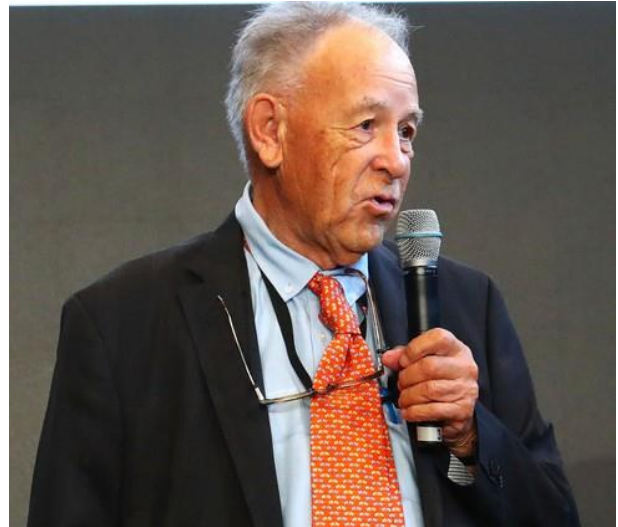
El Dr Roland Devolz fue respetado a nivel mundial

A través de su profundo conocimiento técnico, sabio asesoramiento, el compromiso a lo largo de su vida, y su pasión para asegurar una competencia justa y mejorar la raza SPC, Roland jugó un papel clave al guiar a la Federación en un amplio espectro de temas relacionados con las carreras y la cría.